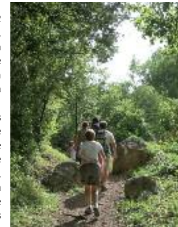
Randonnée autour de Bédarieux

3. 195 m, 31 T 511511 4827002 Monter vers le panneau routier, longer la route, descendre à droite, puis à gauche sous le pont. Prendre le petit chemin menant à une ferme puis à la chapelle Saint-Raphaël. Après la chapelle, passer sous la route et suivre à gauche le sentier qui grimpe à travers le sous-bois et mène à l'ancienne voie ferrée. Se diriger à gauche, emprunter le tunnel puis la voie désaffectée sur plus de 2,5 km. Profiter des multiples panoramas sur Bédarieux.