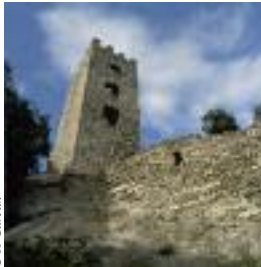
Tour carrée de Colombières-sur-Orb

L'eau est un élément omniprésent à Colombières-sur-Orb. Elle structure le paysage et donne naissance à des sites naturels de toute beauté : la vallée de l'Orb avec sa plaine et ses méandres et les trois torrents (Albine, Arles et Madale) qui, après avoir dévalé les pentes des monts du Caroux, rejoignent le fleuve. Le ruisseau d'Arles a creusé la roche du massif créant ainsi les fameuses Gorges de Colombières et leurs cascades. Celui d'Albine donne