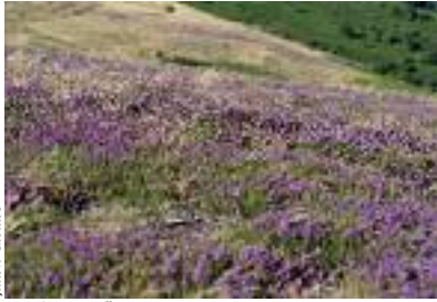
Julien Gieules Bruyères en fleurs

Sur les premiers contreforts de la Montagne Noire, la fontaine Fontgassière, proche du col de Salette, marque le point de rencontre entre trois départements : l'Hérault, l'Aude et le Tarn. L'eau fraîche descend des montagnes et arrose de