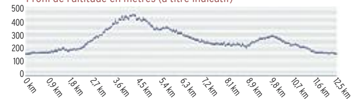
Profil de l'altitude en mètres (à titre indicatif)