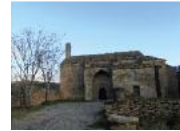
Chapelle de Centeilles

1. Quitter la chapelle et descendre son chemin d'accès jusqu'à la route. L'emprunter à gauche et remarquer la belle capitelle à gauche. Dans le virage à gauche, laisser la route et passer devant la croix, aller tout droit sur le chemin bétonné. Après quelques mètres, s'engager à droite sur le sentier bordé de muret.