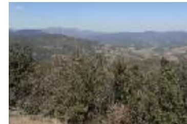
Vue depuis le sentier

La cuve atteinte, obliquer à gauche en montant, puis, à la fourche, de nouveau à gauche vers la chapelle. Celle-ci ralliée, revenir sur ses pas jusqu'à l'intersection et reprendre la piste à gauche. Monter sur 1,8 km jusqu'au col de l'Empeutadou.