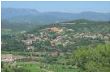
Vue sur le village de Pierrerue

Pierrerue a été bâti autour d'une source : la Font Petrarua, aujourd'hui la fontaine et les lavoirs sont le témoignage de cette vie autour de l'eau.