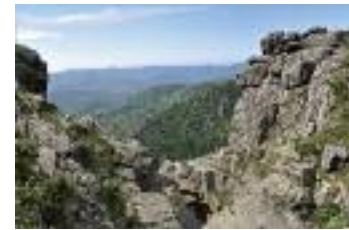
Saut de Vesoles, accès par le sentier des Gardes

2. 498 m, 31 T 485538 4820847 A la patte d'oie, prendre la piste montante à gauche, et après 100 m, obliquer à gauche dans le virage en épingle.