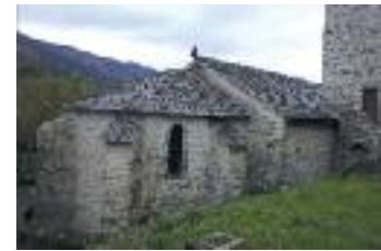
Eglise de la Caminade

3. 536 m, 31 T 485457 4821152 Quitter la piste qui continue tout droit et gravir à droite le chemin en raidillon. Rester sur ce chemin et passer les deux virages en épingle. Rallier la baraque des gardes où a été créé le premier maquis FTPF de l'Hérault. Poursuivre le chemin, prendre les deux épingles suivantes et arriver au croisement de 4 pistes.