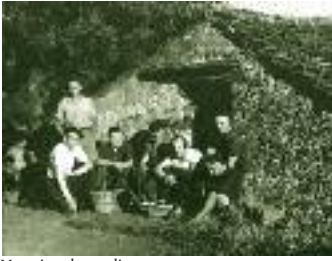
Maquisards - radio

À partir de la fin 1943, des mouvements de Résistance se sont développés dans les Hauts Cantons et, en août 1944, plusieurs accrochages sérieux ont eu lieu avec les troupes allemandes qui se repliaient vers la Méditerranée. Le sentier de la résistance, à Prémian, rend hommage à ces hommes de courage.