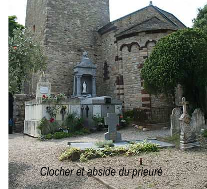
Clocher et abside du prieuré